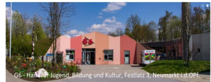
G6-Haus für Jugend, Bildung und Kultur, Festplatz 3, Neumarkt i.d.OPf.

Tel. 09181/5093 690 oder g6@neumarkt.de Die Abstands- und Hygieneregeln sind einzuhalten.